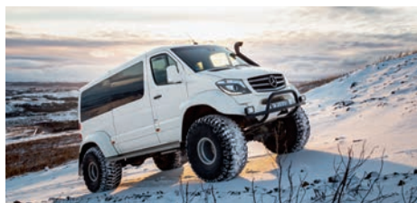
Unterwegs im umgebauten Spezialjeep

Mit versierten Reiseleitern, die das Land aus Feuer und Eis sehr gut kennen und viele Geheimtipps haben, sind Sie in kleiner Reisegruppe unterwegs. Im 4x4-Geländewagen erleben Sie ein wahres Winterabenteuer, denn den Allradfahrzeugen stehen oft mehr Wege offen als den normalen Straßenfahrzeugen.